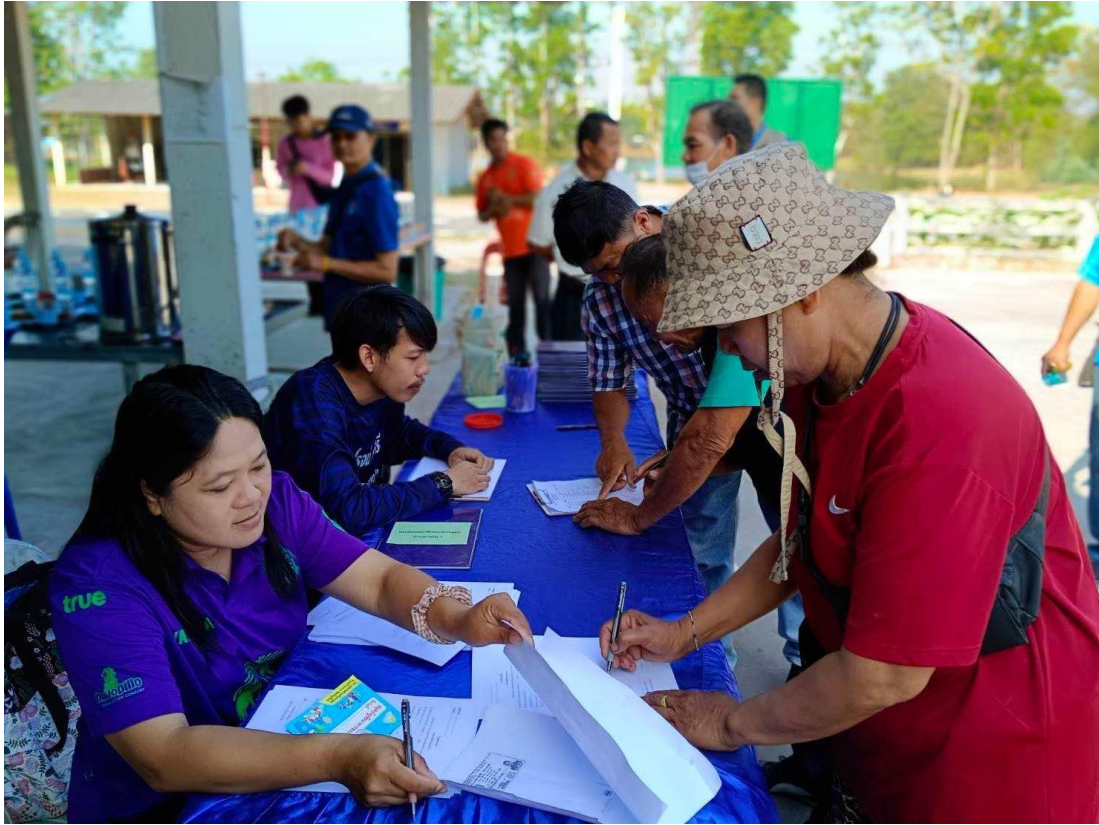
ภาพที่ ๗ กิจกรรมอบรมให้ความรู้ประชาชน ขับเคลื่อนโดยอาสาสมัครท้องถิ่นรักโลก (อถล.)

หมู่บ้าน/ชุมชน โดยการเดินรณรงค์เคาะประตูบ้านทุกหลังคาเรือน และทำหนังสือขอความร่วมมือ หน่วยงานส่วนราชการที่เกี่ยวข้องในเขตรับผิดชอบได้รับทราบ และมีความรู้ ความเข้าใจที่ถูกต้อง