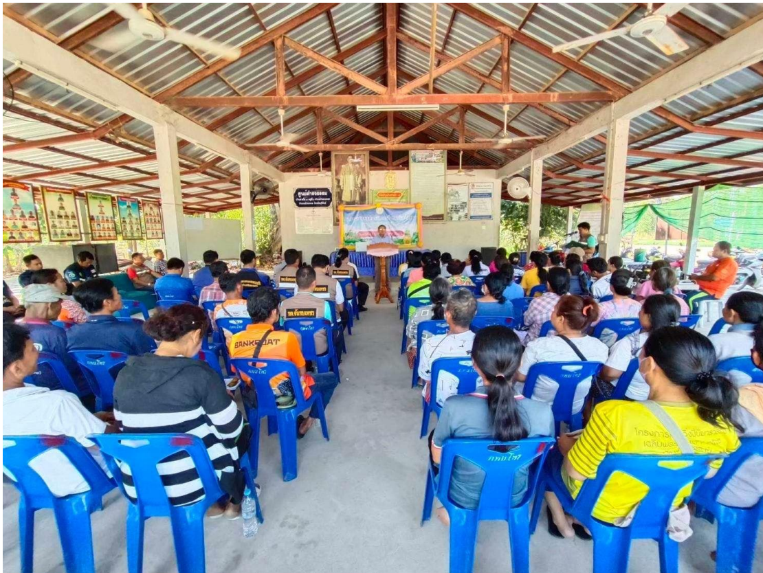
ภาพที่ ๘ กิจกรรมแกนนำ