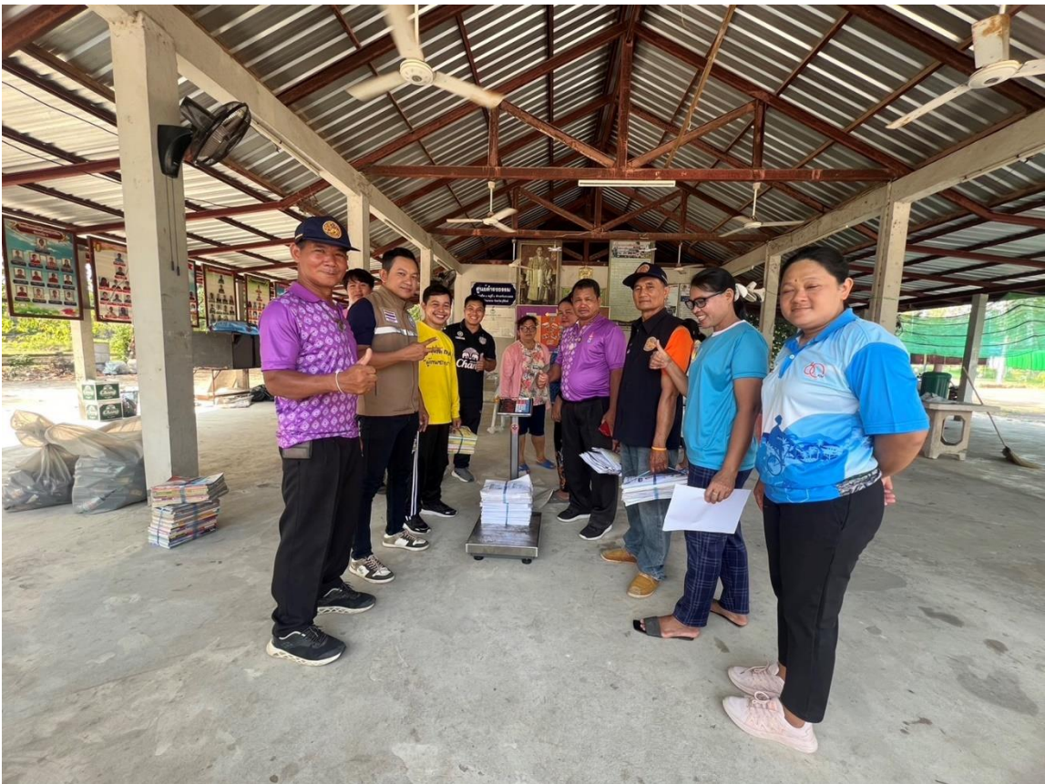
ภาพที่ ๒ การจัดประชุมสะท้อนข้อมูลให้ชุมชน และรับฟังความคิดเห็นการดำเนินงานธนาคารขยะ(Recyclable Waste Bank) โดยจัดทำเป็นธรรมนูญชุมชน/หมู่บ้าน เพื่อส่งเสริมการคัดแยกขยะที่ต้นทาง