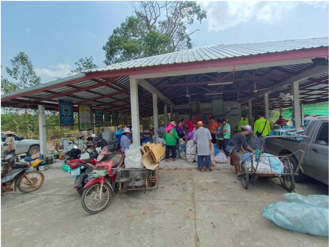
ภาพที่ ๑ การสำรวจข้อมูลขยะมูลฝอยระดับครัวเรือน การจัดการขยะมูลฝอย การคัดแยกขยะมูลฝอย และขยะรีไซเคิลในพื้นที่